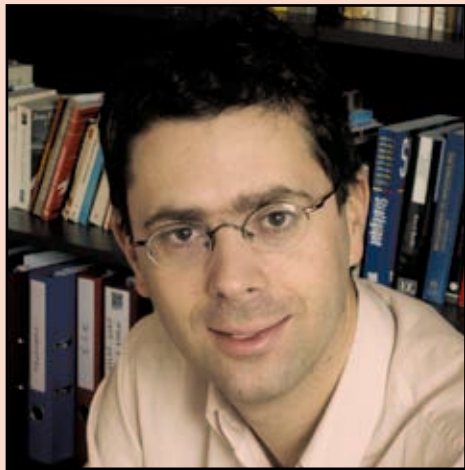
«Depuis la crise, on a observé une forte fuite vers l'épargne dite de précaution.» Nicolas Bouzou, économiste chez Asterès.